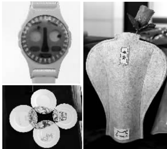
瓦当手表、传世韵碟、毛毡花瓶

快报讯(记者 胡玉梅)昨天,在瞻园举行的南京市博物馆总馆文创设计大赛获奖作品暨颁奖作品展上,设计师们纷纷放“毒”:可以吃“吃”的六朝瓦当、可以戴的洪福“麒”天首饰,可以用的萧何月下追韩信青花瓷盘……现代快报记者发现,300