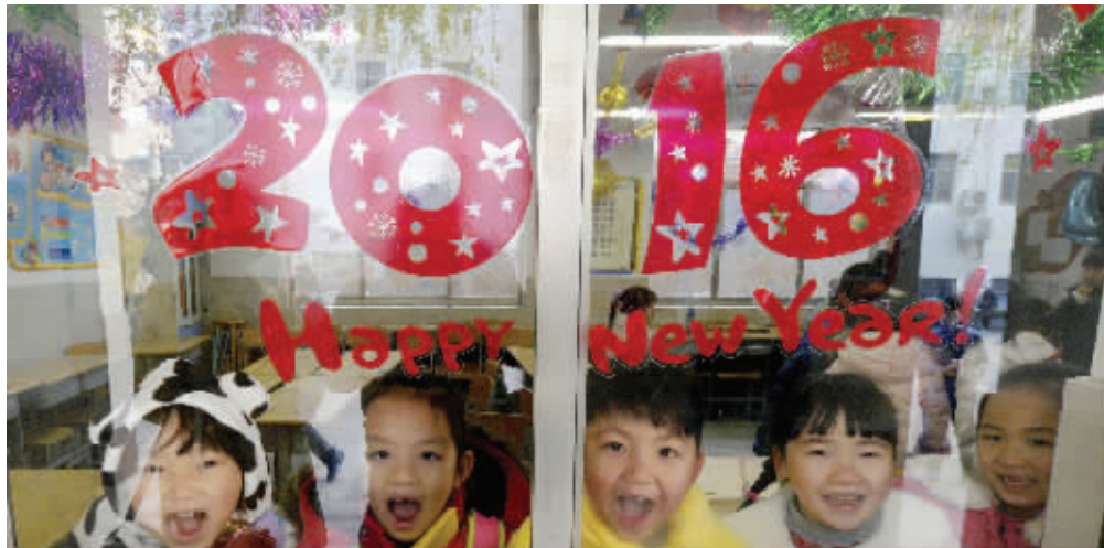
南京鼓楼一中心小学孩子们迎新年