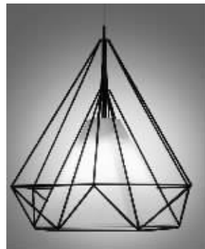
铁艺灯具已逐渐流行