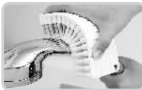
水龙头花洒需要经常清理