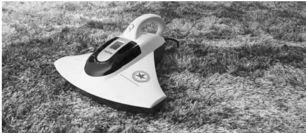
除螨机对于螨虫以及其他过敏源有较好的清理效果

农历新年临近,除旧迎新作为中国人历来的传统,一直是年底“全家总动员”的大事件。但是大扫除是一项大工程,要把屋子里所有的角角落落都清理干净,可不是轻松的事情。那么,让我们来学学达人们的大扫除妙招吧。