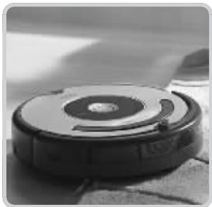
扫地机器人的使用已较为普遍

清理完地面,下面应该要做的就是擦玻璃了,经过了一个夏天的雨淋和前几天的飘雪,许多人家的窗户都已经“不堪入目”了。虽然现在有磁吸式的擦玻璃器,但是要么设计不够贴心造成使用不顺手,要么清洁能力不够,想要安全干净又方便打理家中的玻璃,还真不是一件容易的事。所