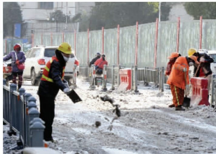
南京一些路段积雪成冰,环卫工一大早就赶到现场清除