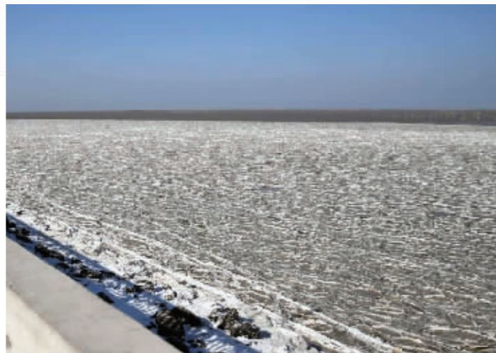
连云港连云区连接西连岛的拦海大堤北侧出现壮观冰带