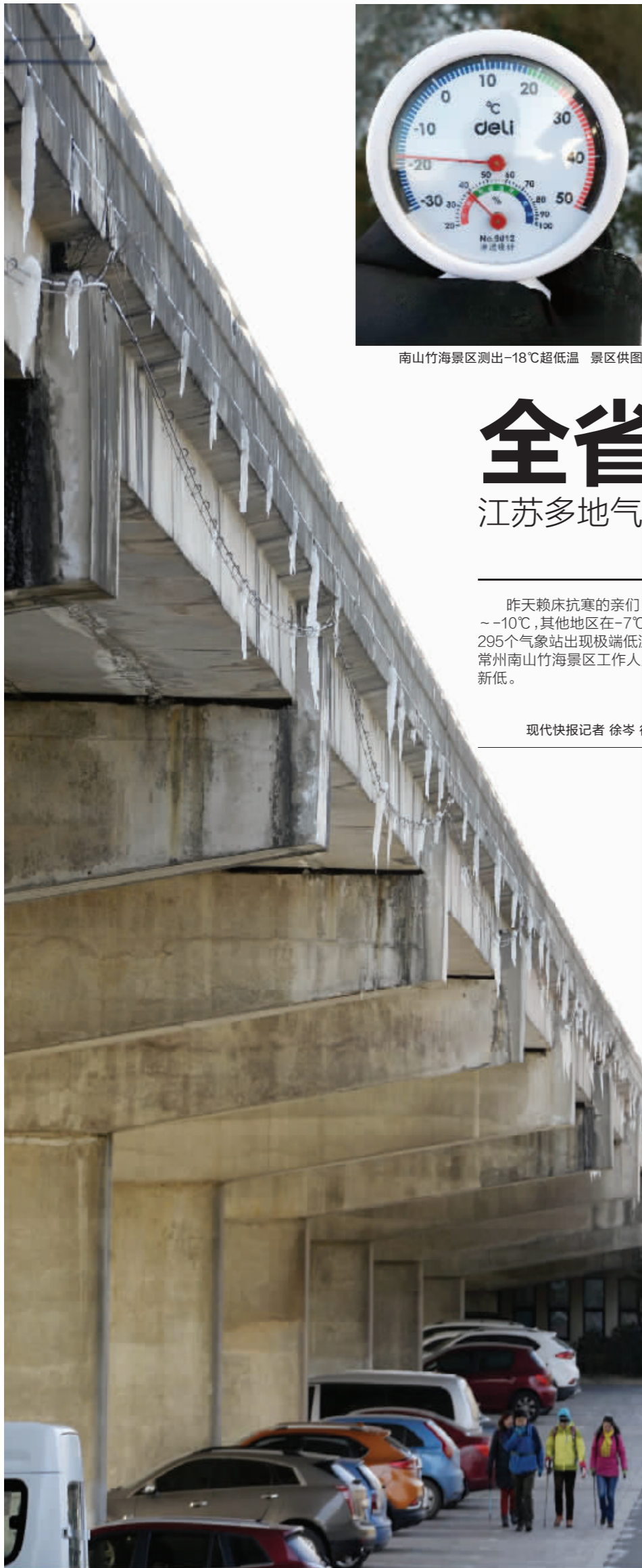
昨天,南京气温降到-10℃,首蓿园大街附近的高架桥上挂起又大又粗的冰凌,很危险

南京三日天气 今天 晴到多云,偏西风逐渐减弱到4级,有冰冻,-8~2℃ 明天 晴转多云,有冰冻,-5~6℃ 后天 多云转阴有小雨,局部冰冻,-2~8℃