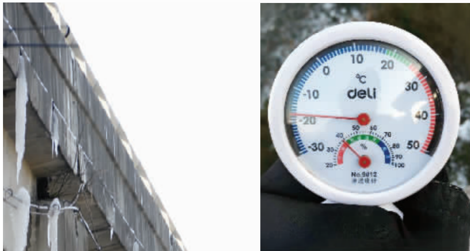
南山竹海景区测出-18℃超低温