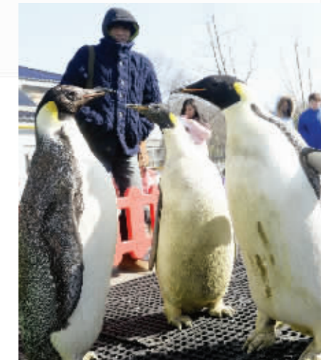
南京海底世界企鹅昨天终于出来晒太阳了