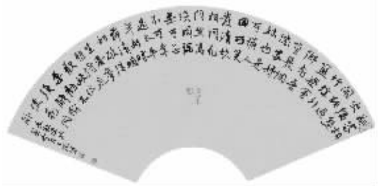
朱敦儒《暮山溪·邻家相唤》 王卫军