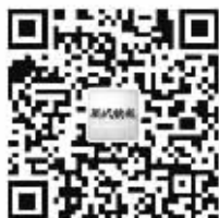
现代快报官方微信