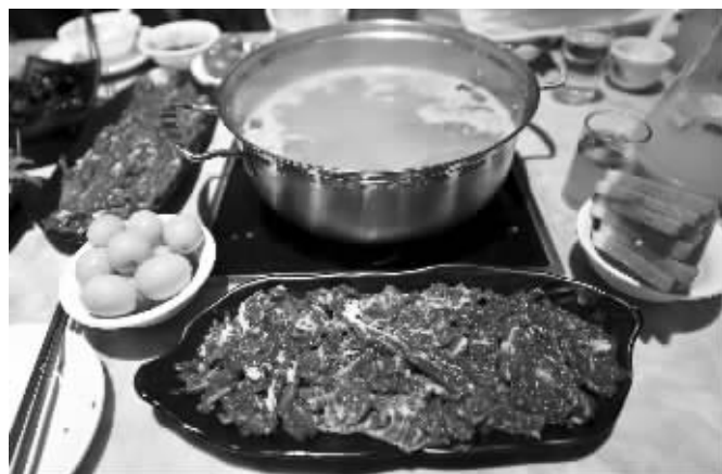
先喝碗牛肉汤暖胃再开涮

“2016南京火锅大会”进入第三周。本周,“天天特惠”活动继续。今天,快报联合亿牛鲜牛火锅,为读者带来史上最大力度特惠活动,火锅全场3折。今天,凭现代快报或官方微信,到店消费,即可享受全场3折特惠。