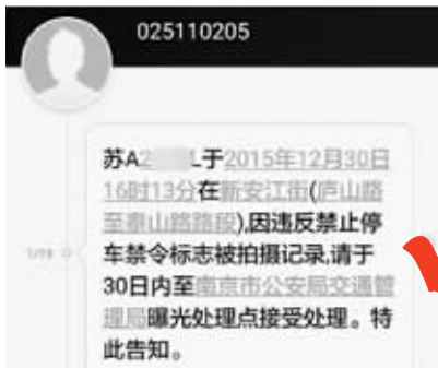
交管部门发布的曝光短信