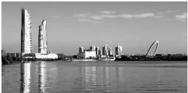
青奥双塔

快报讯(通讯员 王文波 曹为勇 记者 马乐乐)昨天,现代快报记者从江苏省建筑施工技术创新现场观摩会上了解到,河西青奥双塔将于今年年底竣工,明年有望投入两会的使用中。