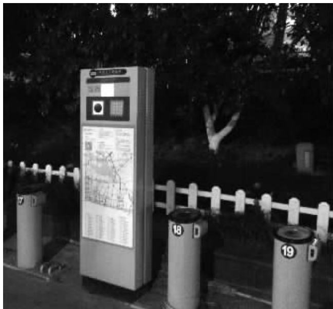
长江路上的公共自行车点

快报讯(记者 杨菲菲)最近,有细心市民的发现,长江路上多了一些公共自行车站点。昨天,现代快报记者从南京市公共自行车有限公司相关负责人处得知,这些公共自行车是上个月投放的,主城六区共新建了383个站点。截至目前,主城六区站点数已达到630个。而全市的办卡点有36个,在公共自行车站点的终端服务器背面就可以查看。