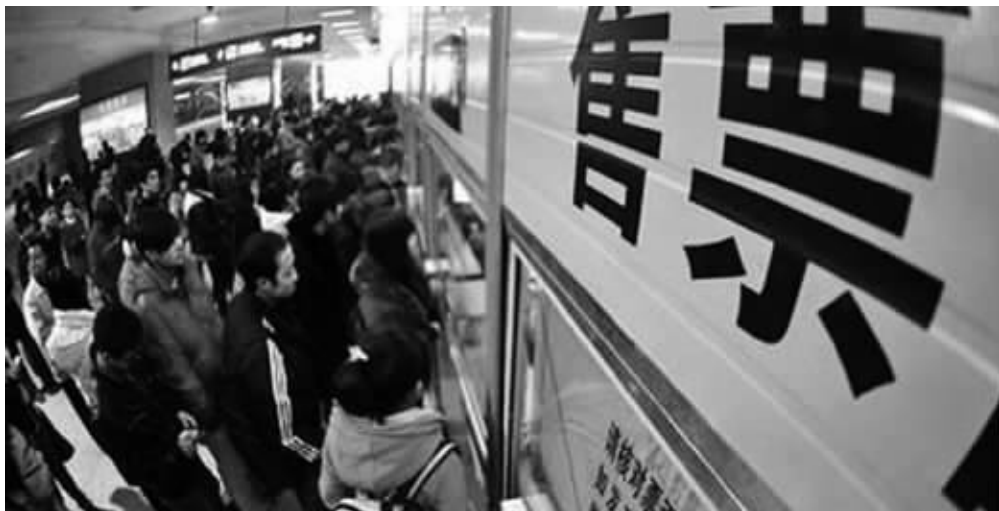
每年春运都迎来客流高峰 资料图片

此外,图定旅客列车变更运行区段1.5对:节前连云港东~乌鲁木齐南K1354/1次0.5对改由南京始发;西安~南京K396/3 K394/5次1对延伸至苏州终到、始发。