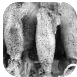
连云港人爱吃的子乌

过年,连云港人的餐桌上少不了海鲜。黄鱼、对虾、子乌、螃蟹都是港城人最爱吃的。过年前,海鲜市场生意最火爆,顾客现场挑选,现场称,选好后直接放在空的泡沫箱中,一人一箱搬回家。