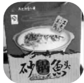
天目湖砂锅鱼头礼盒

常州也算是靠湖吃湖的典型,说起买年货,各种与天目湖有关的系列产品,成为常州人的最爱。另外,无节水芹、太湖三白也是送礼佳品,还有芝麻糖、梨膏糖和常州萝卜干,也是备受欢迎的年货。