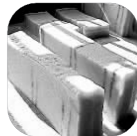
南通蒸糕 本组均为资料图

南通的年夜饭餐桌上,少不了“花露烧”的酒。以前都是自家酿。此外,南通过年流行蒸馒头蒸糕,年前都会备好。