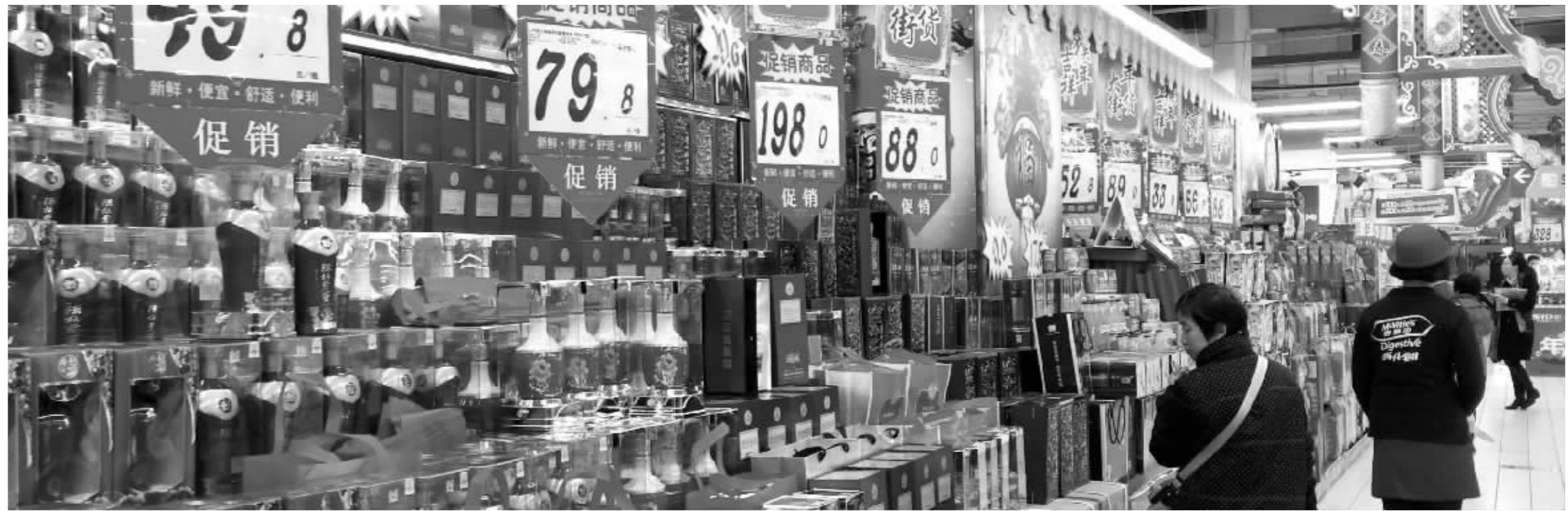
南京一家超市内的年货大街