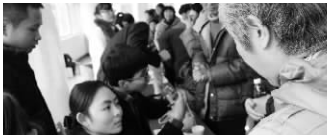
为吃好新春团圆宴,缺牙患者到康贝佳排队预约种牙

近日从各口腔医院获悉,进入2016年以来,缺牙患者就诊量明显上升,其中康贝佳口腔医院的种植牙接诊量较平时提高四五成。牙齿种植没季节要求,为何农历年底求诊人数骤增?