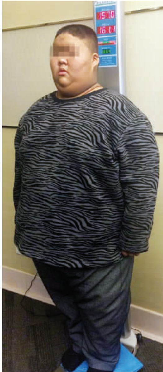
2015年12月28日他才322斤,半个多月又胖了7斤

专家说,与传统的切胃手术不同,这个手术是可以逆转的。如果孩子长大成人,认为体重已经降到合理程度,希望恢复到胃的本来状态,那么二次手术就可以恢复。