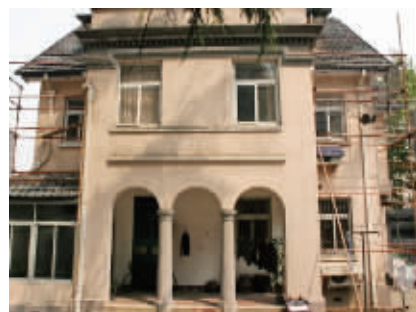
土耳其驻中华民国大使馆旧址