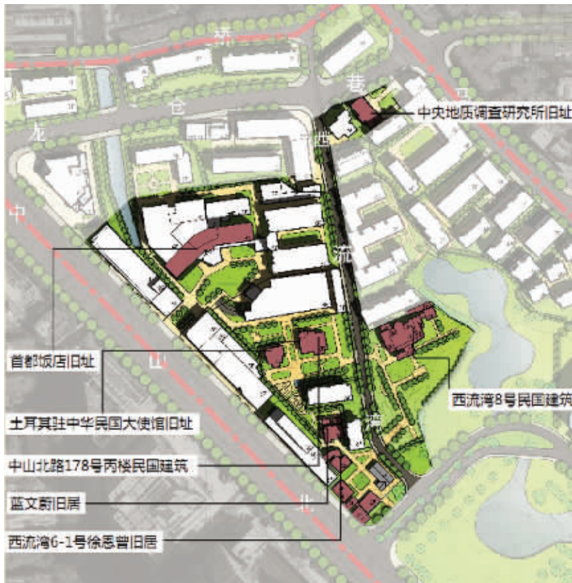
民国风情街区步行线路图

未来做什么?这次规划中也建议,0405地块拆迁完成后,需要结合周边环境整体规划,建设一处新的符合湖南路地区形象的城市综合体。