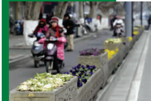
南京的街头绿植