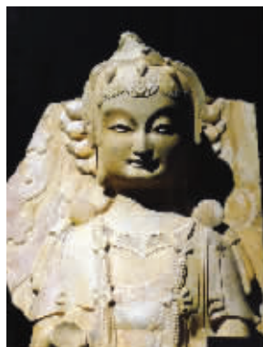
贴金彩绘石雕左肋侍菩萨像