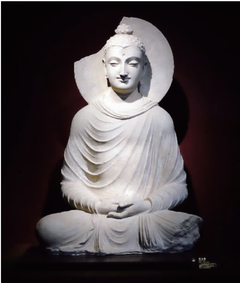
这尊犍陀罗坐佛高达1.24米,距今已经有1900多年,举世罕见

这批宝贝,都来自龙兴寺遗址窖藏。1996年在青州龙兴寺遗址偶然发现了一座窖藏,出土佛教造像400余尊,时代跨度从北魏晚期至北宋,被评为当年“全国十大考古新发现”之一,随之入选“二十世纪中国百项考古大发现”。“青州风格”的佛教艺术被誉为可以改写中国艺术史的杰作。