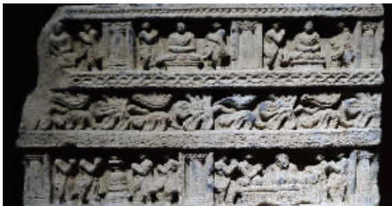
“分奉舍利、造塔”雕塑堪称孤品