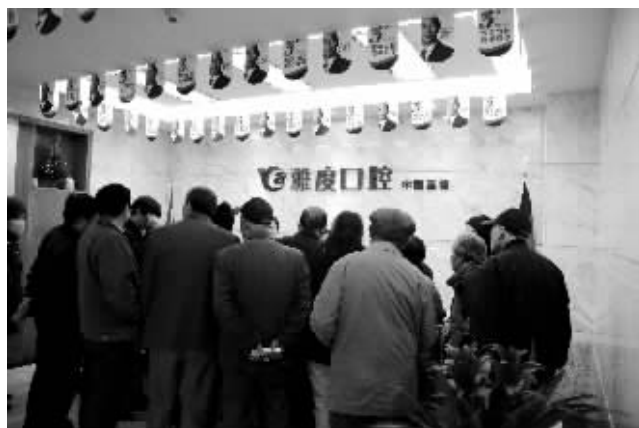
年终巨惠引金陵种牙热潮