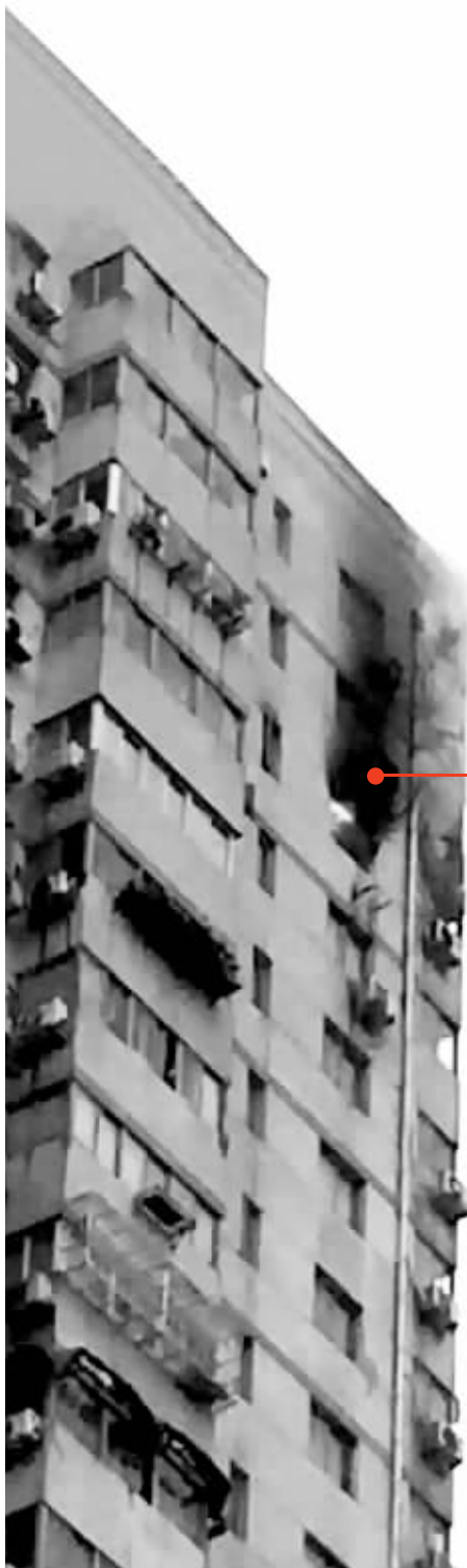
大火从远处就可以看到

昨天早上7点多,鼓楼区福建路65号高层住宅突发火情,26楼一住户家中起火,火光熊熊,玻璃从高空炸裂飞落,楼上两家住户都连带受损。这幢楼共计29层,所幸的是,楼上住户们被及时疏散下楼,失火的房主也及时撤出屋子,火灾没有造成人员伤亡。