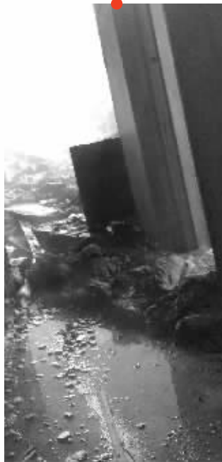
失火的住户家,卧室被烧毁