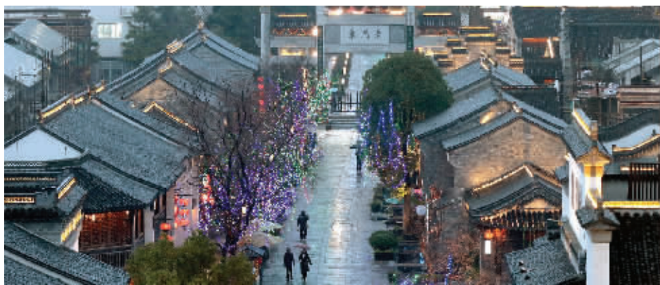
10位历史名人雕像中的一半将立在南京老门东的“一馆两院”