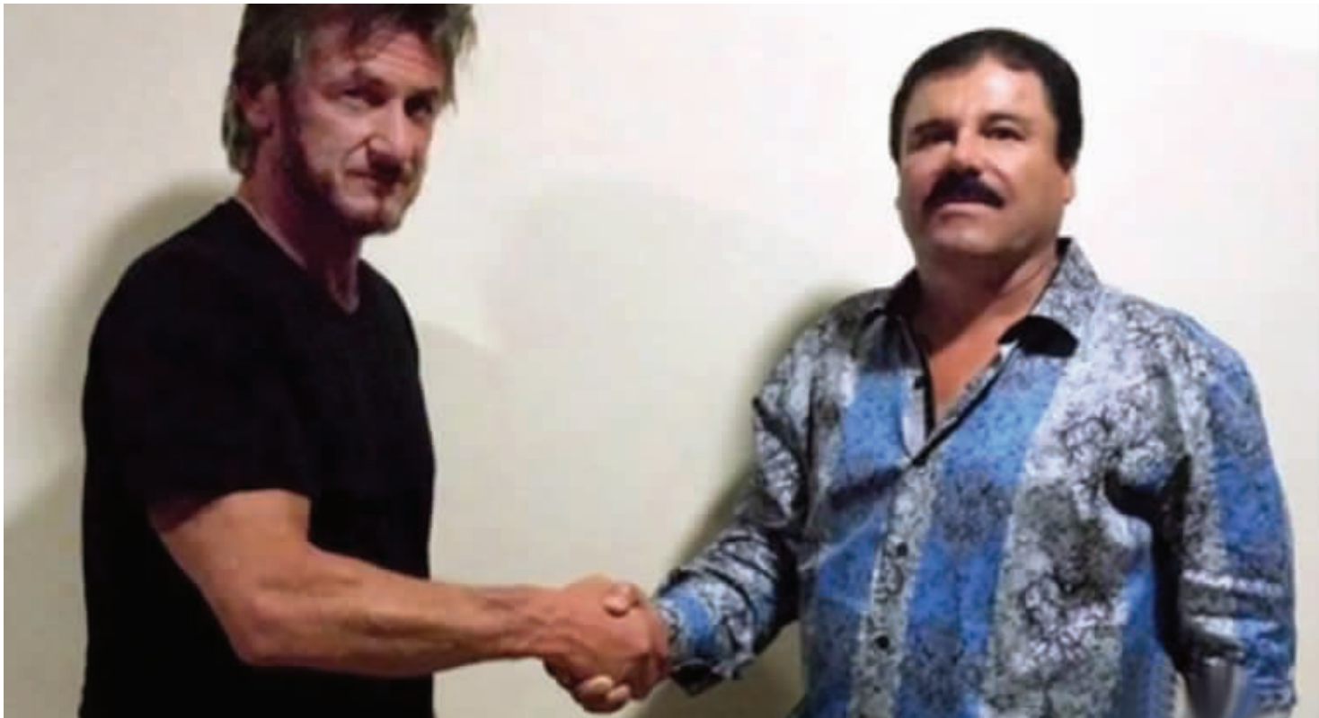
美国老牌影星西恩·潘(左)与墨西哥头号毒枭华金·古斯曼握手