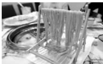
老锅底火锅的涮菜