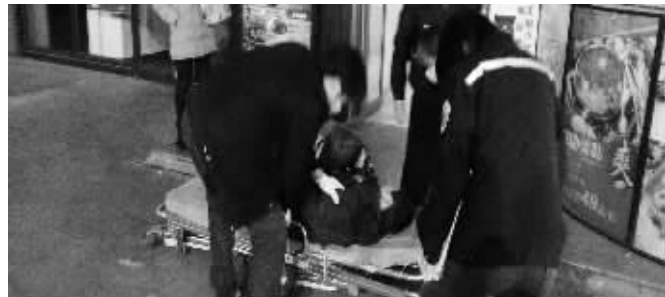
一名大妈差点晕倒,被扶上担架吸氧