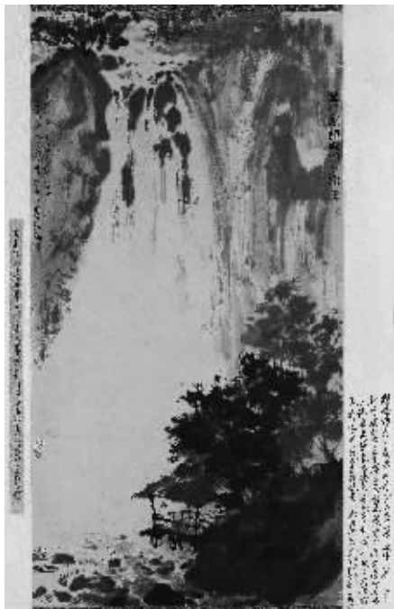
傅抱石《观瀑听泉图》

术品收藏投资讲堂等活动,增强普通老百姓的参与性和互动性,极大地储备了更多的艺术爱好者和潜在客户。目前据初步统计,明确有购买意向的拍品总额已达到了一千多万。本次嘉恒征集的拍品不仅有傅抱石、齐白石、张大千、钱松岳等大师名作,更多的还有性价比极高、很接地气、雅俗共赏的艺术精品。据悉,嘉恒本次秋拍于元月8日、9日在南京丁山花园酒店预展,元月10日上午9:30开槌。