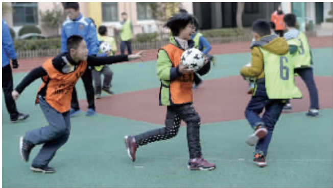
这场足球训练,孩子们学得很开心