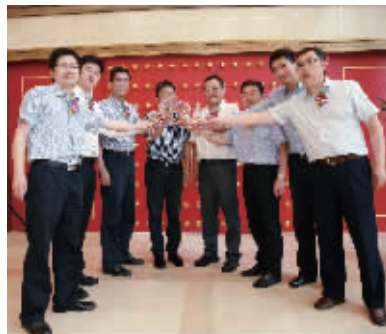
常州高新区企业汉德利在新三板挂牌上市

五年来,常州高新区始终坚持稳中求进的发展主基调,主动应对复杂多变的国内外经济形势,按照集聚新兴产业、建设新城区、建立新体系的总体思路,全面实施“创新驱动、科教强区、城乡一体化、经济国际化、可持续发展”战略,全区经济社会发展实现新跨越。