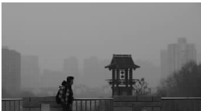
昨天,南京遭遇中度污染

淮东北地区更冷,早晨将开启冰冻模式,最低气温在-3到-4℃,最高温度在5℃左右。