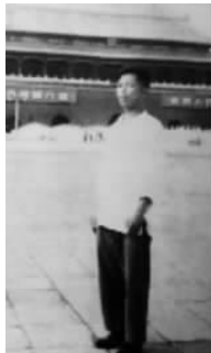
1958年7月王汝祥在北京天安门