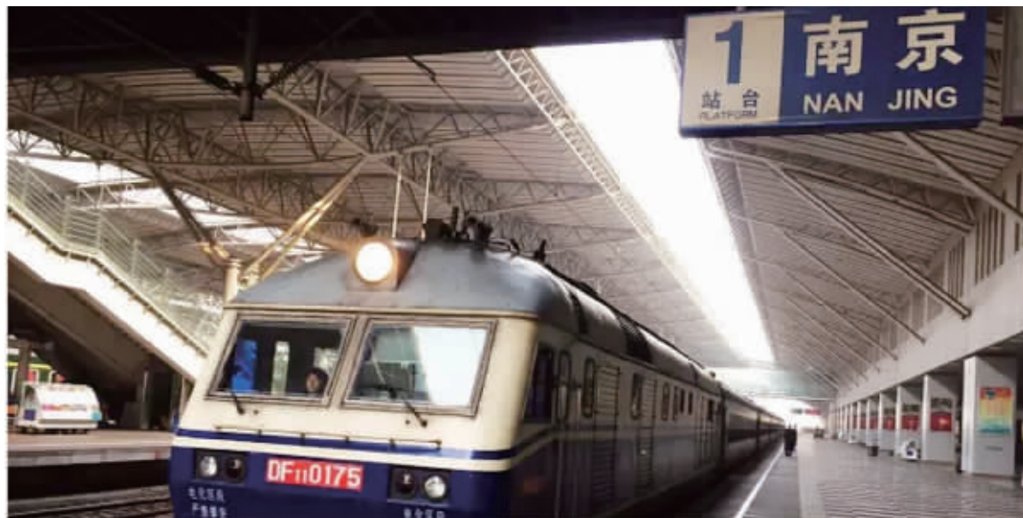
你好,这里是南京开往黄山的7101次列车

今天早上6点钟,南京到黄山的最后一趟绿皮车7101次列车驶离南京。自明天起,7101次列车停运,后天起,黄山开往南京的7102次列车也将退出历史舞台。从此,江苏将告别“绿皮车时代”。今天,现代快报记者登上最后一趟7101次列车,与车上的乘务员和乘客一同送别这辆带着青春记忆的绿皮车。