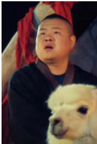
节目录制中的TFBOYS和岳云鹏