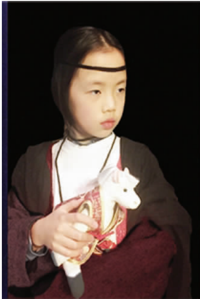
达·芬奇的《抱兔女郎》 点评:怀里抱的是什么生物?