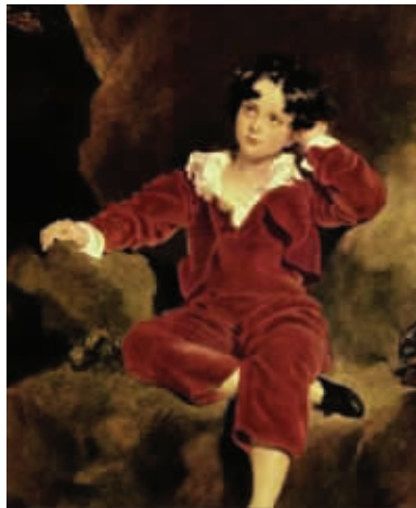
托马斯·劳伦斯的《红衣男孩》 点评:睡衣不错哦!