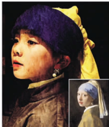
荷兰画家维梅尔的《戴珍珠耳环的少女》 点评:气质绝佳,毫无违和感!