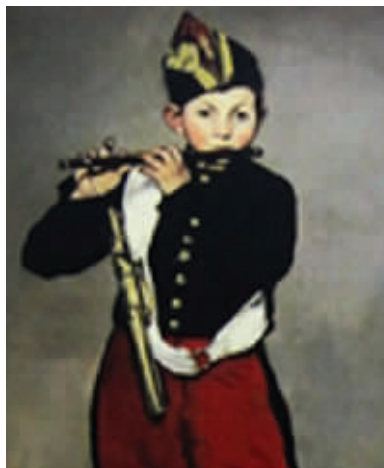
马奈的《吹笛子的少年》 点评:总觉得有点不对劲,你看出来了吗?