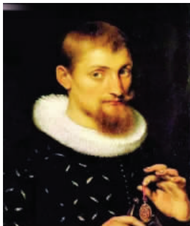
鲁本斯的《青年学者》 点评:领子好赞,哪买的?