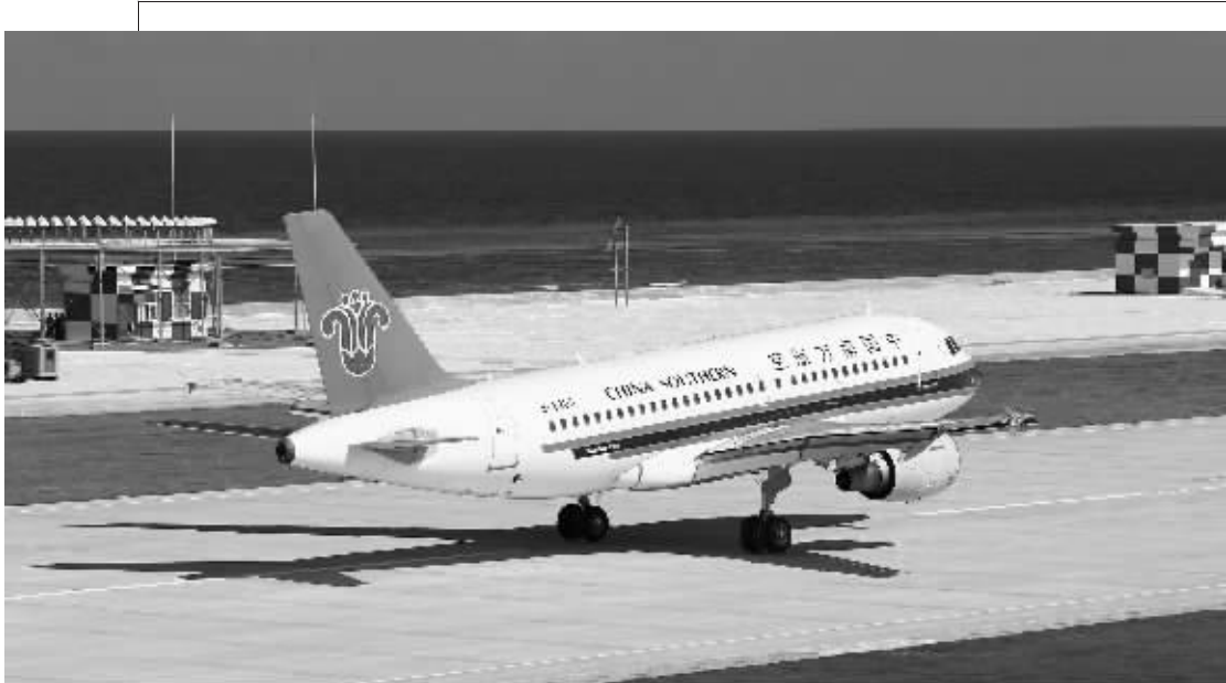
1月6日10时21分,南方航空的飞机降落南沙永暑礁新建机场