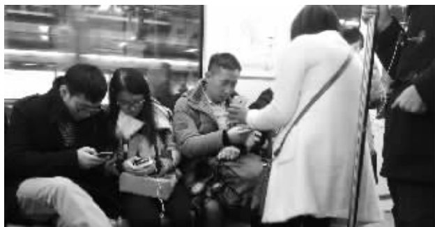
地铁车厢内,这位大妈举着手机与人搭讪

地铁里低头族司空见惯。一些自称“创业者”的人却抓住这个机会,不厌其烦地挨个儿“求关注”。“陌生人求粉,我一般不会接受。不过,当时我正好刷着手机,也没有别的事,看起来举手之劳,要当面拒绝,还真有些尴尬。”一名大学生说。