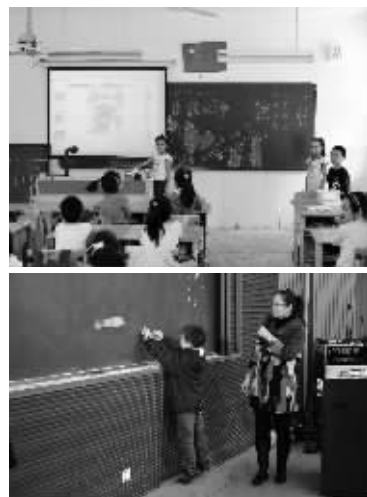
小老师们在课堂上