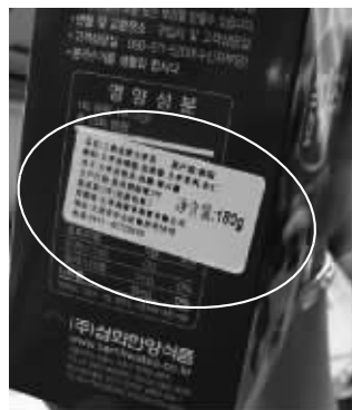
没中文标签的进口食品最好别买 资料图片

但是很多大型超市里销售的进口食品并没有中文标签,那是怎么回事儿呢?检验检疫工作人员表示,这种属于“原料进口”,也就是由国外厂商提供原料或产品,再到国内进行分装或加工、包装,这样的食品并不能算做真正意义上的进口食品。