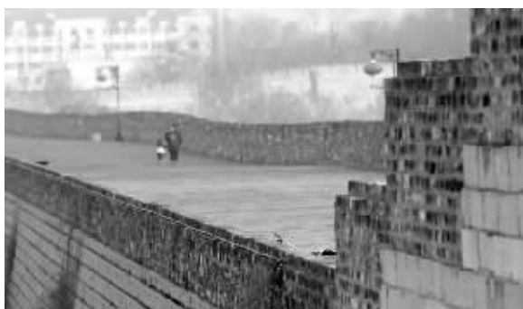
南京城墙中华门段