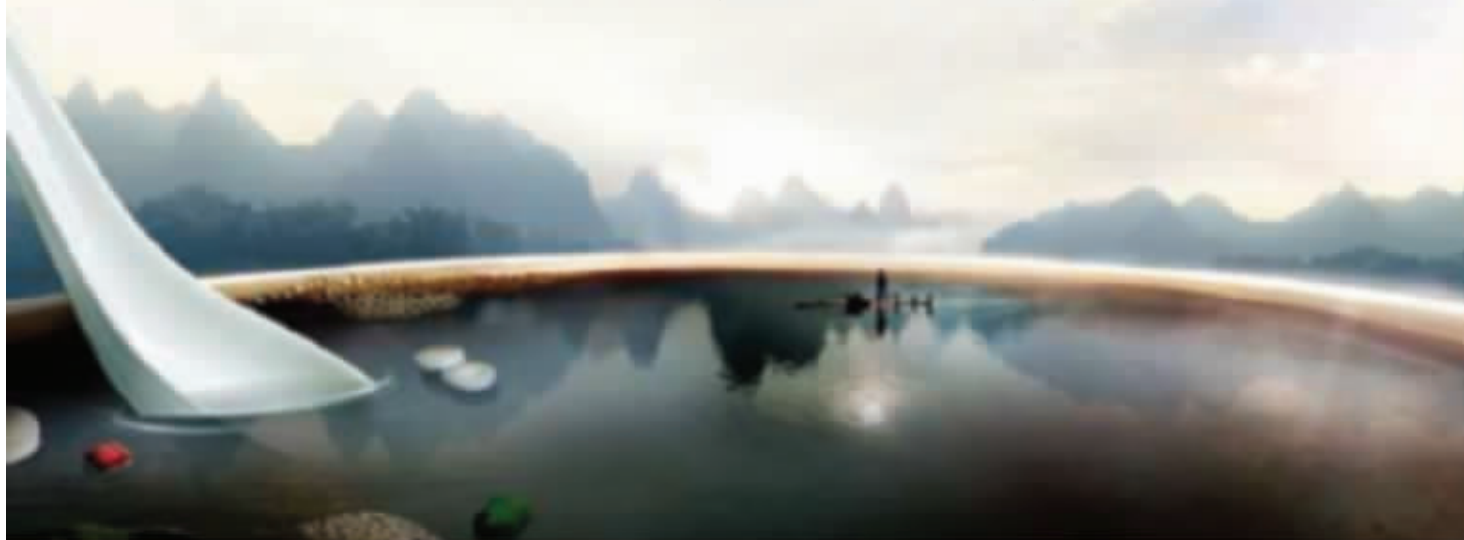
纪录片《舌尖上的中国》海报 资料图片

如今国内电影市场一片大好形势,大IP、小IP都会被改编成电影捞票房,所以当热门纪录片“舌尖上的中国”团队去年透露将拍电影的时候,并没有引起圈内太多的关注。可这部由“舌尖”团队打造的大电影《舌尖上的新年》本月7日公映之前,却意外带来不少争议。