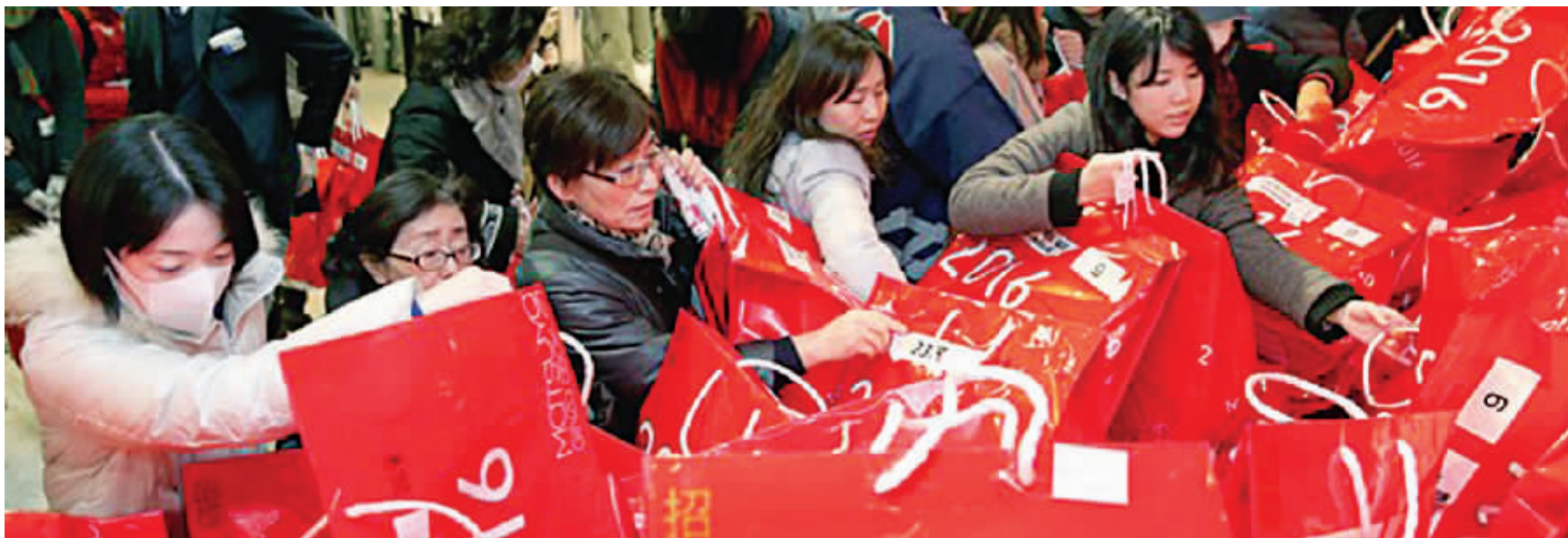
人们在百货公司里抢购今年的新年福袋