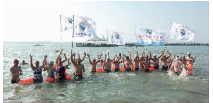
冬泳爱好者不惧严寒,精神抖擞

快报讯(见习记者 王兰芳 记者 姜振军)1月1日,来自盐城各县(市)区的100多名冬泳爱好者齐聚阜宁金沙湖,以冬泳的方式迎接元旦和第21个全国冬泳日。