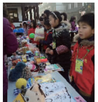
小学生在吆喝兜售

这仅仅是西溪元旦系列活动中的一个。在晏溪书院国学讲堂里,孩子们用心聆听,举手投足彬彬有礼;西溪大舞台的“相伴国学经典 传承中华文明”系列活动如火如荼;状元拜通圣桥跨马巡街引来游客追逐拍照;董永七仙女文化园里古代婚俗演示让新人们体验千年古镇的民俗风情;还有杂技表演、京剧票友演出、综艺演出和武士巡逻等,让游客们流连忘返。