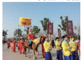
状元骑马