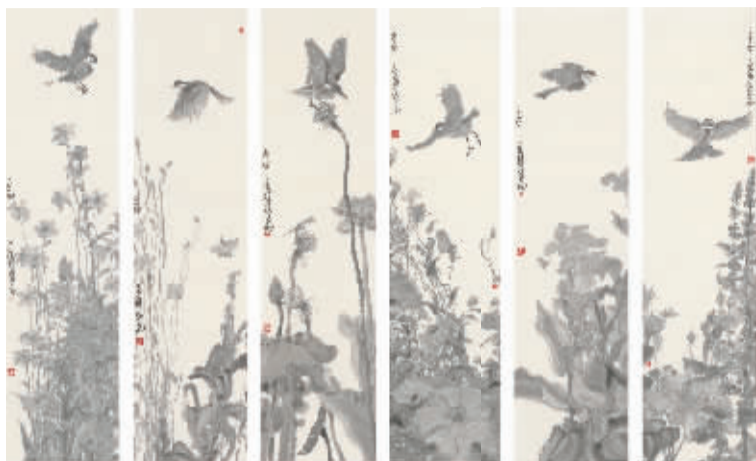
周京新《羽花蝶六条屏》