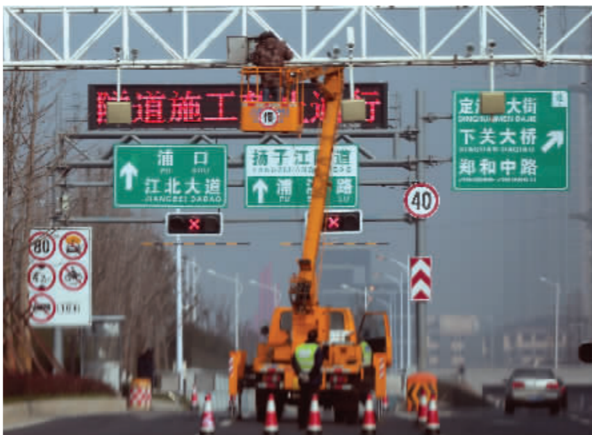
扬子江隧道出入口暂时封闭,明天正式通车

中门总站,沿途约19站。D15为大站快车,过江后将与地铁2号线和在建的地铁4号线无缝对接,确定票价为全程无人售票投币3元,刷卡8折。 隧道在凌晨1点到5点维护 扬子江隧道是特殊的交通运输工程,隧道内有包括监控、消防、通风、通信、配电等在内的十余项子系统。隧道的管养现场作业均集中在夜间1:00-5:00封道期间进行,封道期间将由各专业队伍实施系统检测及维修、保洁作业。 此前,记者了解到,扬子江隧道开通后,为了确保夜间仍有一条通道可以连通江北与主城应对突发状况,有望在夜间与长江隧道交替封闭。不过,具体方案仍未确定,暂时市民夜间免费过江只能走长江大桥。 注意观察指示标志,别走错车道 交管部门提醒,江北出入口均位于浦镇大街,通过定向河立交与江北大道快速路对接。江北通往江南的隧道入口分为2个通道,一个是连接扬子江大道(南、北2个方向)的出口,另一个是通往定淮门大街、江东北路的出口。 江南往江北方向的入口,一个位于定淮门大街定淮门大桥以西;另一个位于扬子江大道(由南向北方向)和定淮门大街的漓江路以西(由东向西方向)。 因扬子江隧道在江北的唯一入口分为2个通道,对应江南出口方向不同,因此,江北驶往江南方向的车辆,进入隧道前,应注意观察指路标志,根据目的地提前选择好车道,严禁在隧道内变道。 走这条隧道的尽量选择扬子江大道通行 江东北路定淮门大街路口主线南向西左转仅1股车道,因此,经河西地区需通过扬子江隧道过江的车辆,应尽量选择扬子江大道通行,避开江东北路定淮门大街节点。 据了解,扬子江隧道由市公安局交管局五大队管辖,负责管理隧道的交通秩序,处理隧道内发生的交通事故。