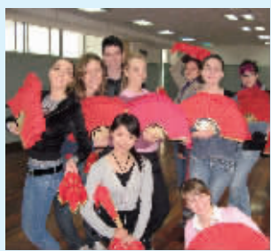
意大利友好学生来访