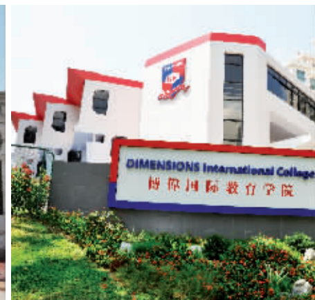
博偉国际教育学院高等教育校区