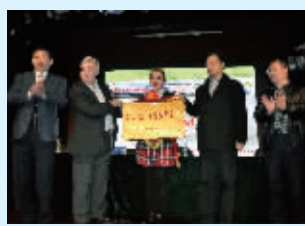
设立国际职业教育教学基地