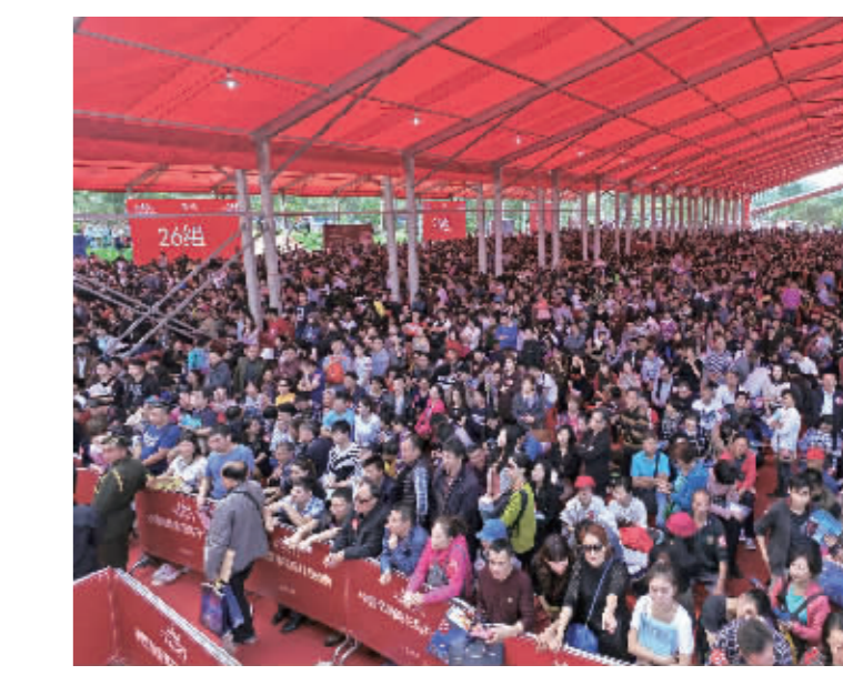
海花岛现场如同楼市“春运”

海花岛名片 海花岛是恒大在国家“一带一路”框架下, 投入1600亿在海南打造的世界级文化旅游项目, 项目总占地8平方公里, 是迪拜棕榈岛的1.5倍, 汇聚了600位国际设计大师的智慧, 涵盖了全球超大的国际会议城、世界最大酒店群、全球原创世界童乐乐园、海洋世界、水上乐园、国际购物中心、商业街、美食街、博物馆、温泉城等28大业态, 创下“全球最大花型人工岛”等多项世界之最纪录。