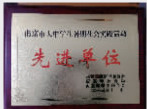
学校获南京市大中学生暑期社会实践先进单位

走进六合中专校“红马甲”活动室,墙壁上悬挂的一面面奖牌无声地向我们诉说着六合中专校青年志愿者们的付出与成长:学校的“教学做实践周”活动被评为南京市优秀三创德育活动;“雨花情”志愿者协会获得南京市优秀青年志愿者组织暨南京市大中学生暑期社会实践优秀组织称号,该协会还被评为南京市职业学校优秀学生社团;学校被评为南京市青年志愿者基地、南京市大中学生暑期社会实践先进单位。近3年来,有500多名参与志愿者活动的同学获得省市三创学生、省市优秀学生干部、南京市优秀青年志愿者、南京市“优秀义工”、六合区“志愿达人”、南京市暑期社会实践先进个人等荣誉称号。如今,六合中专校有了更高的追求,那就是逐步将志愿活动上升为“志愿文化”,以行动引起行动,以灵魂唤醒灵魂,让道德教育“跃动”起来,在师生群体中产生持久而自觉的道德使命感,为社会传递正能量。