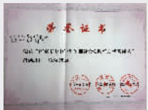
南京市大中学生暑期社会实践活动优秀团队