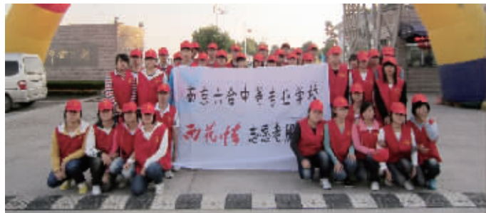
金牛湖景区志愿者服务

走进六合中专校“红马甲”活动室,墙壁上悬挂的一面面奖牌无声地向我们诉说着六合中专校青年志愿者们的付出与成长:学校的“教学做实践周”活动被评为南京市优秀三创德育活动;“雨花情”志愿者协会获得南京市优秀青年志愿者组织暨南京市大中学生暑期社会实践优秀组织称号,该协会还被评为南京市职业学校优秀学生社团;学校被评为南京市青年志愿者基地、南京市大中学生暑期社会实践先进单位。近3年来,有500多名参与志愿者活动的同学获得省市三创学生、省市优秀学生干部、南京市优秀青年志愿者、南京市“优秀义工”、六合区“志愿达人”、南京市暑期社会实践先进个人等荣誉称号。如今,六合中专校有了更高的追求,那就是逐步将志愿活动上升为“志愿文化”,以行动引起行动,以灵魂唤醒灵魂,让道德教育“跃动”起来,在师生群体中产生持久而自觉的道德使命感,为社会传递正能量。