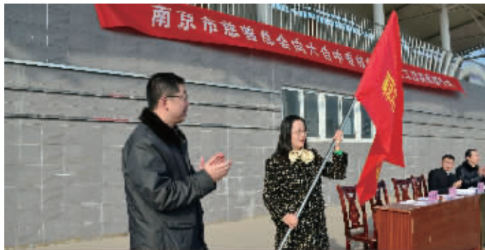
南京市慈善义工团队

动;为促进交通安全,对区内电动自行车存在的安全隐患进行研究,写出报告,对超载渣土车造成的交通设施和环境的损害进行社会调查,向交管部门反映。此外,每年都会开展“六一”游园志愿者服务,“十一”金牛湖志愿者服务,地铁志愿者服务,春运志愿者服务以及各类大型比赛现场的志愿者服务等等,他们总是以最敏锐的听觉,感应最微弱的声音;以最温暖的行动,闪现着人性中向善的光辉。