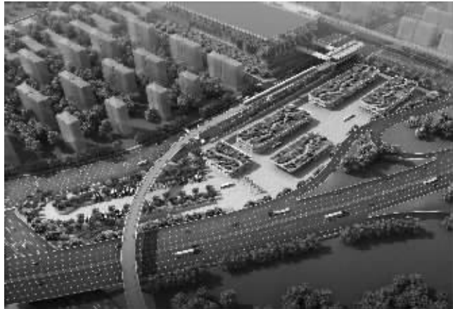
马群换乘中心效果图