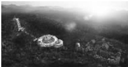
圆通禅院及金刚阁效果图