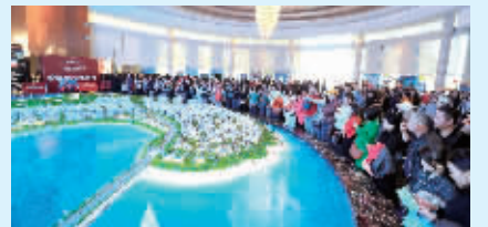
海花岛现场如同楼市“春运”