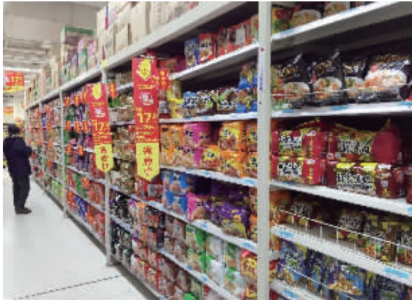
超市里的康师傅方便面涨价了