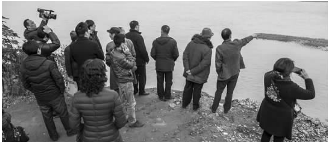
专家考察江口沉银遗址

“石龙对石虎,黄金万万五”,一首在四川省眉山市彭山区江口镇流传数百年的童谣,成为无数人追求张献忠财宝的“寻银诀”。12月25日,在实地查看江口沉银遗址、参观出土文物后,故宫博物院考古研究所所长、故宫博物院原副院长李季和中国国家博物馆综合考古部主任杨林,中国人民大学教授、明史学会常务副会长毛佩琦等10余名专家,共同出具《四川彭山“江口沉银遗址”考古研讨会专家意见书》,基本确认彭山“江口沉银遗址”,为张献忠沉银中心区域之一。据《华西都市报》