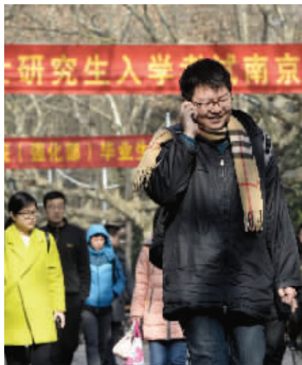
南京大学考点,考生走出考场

有教育界人士表示,以往,研究生的培养与经济社会发展不相适应,不少硕士只会写论文,但不能解决实际问题,动手实践能力差。而专业硕士的培养更侧重与行业接轨,所以市场前景看好。据悉,江苏将增加招生的专业硕士,集中在工程、临床医学、教育、会计等40个与经济发展结合紧密的专业领域,未来三年,每年也将新增5000名专硕。