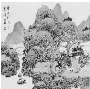
张筱膺《青山门外白云飞》