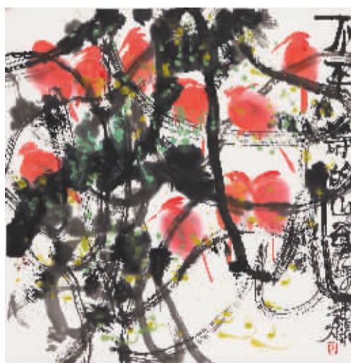
叶烂《不平静的山谷》

生于江苏南通。1982年毕业于南京艺术学院美术系油画专业,师承苏天赐先生,致力于传承和发展林风眠先生中西艺术结合的艺术理念。其艺术创作跨越油画、中国画、书法等诸多领域。近期的艺术实践中,吴维佳有意将中国画、书法中的表现特性与油画的表现特质相互结合,主张在画面空间中加入线性表达,以单维、二维的阅读方式接近东方式的观看体验,强调作品表现中的书写性,从而营造自己独有的艺术本体。