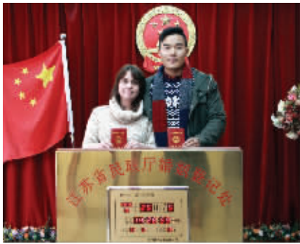
卢娜和小李特地挑圣诞节来领证