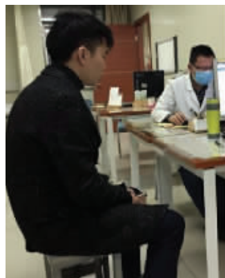
驾驶人是个小伙,已被刑拘