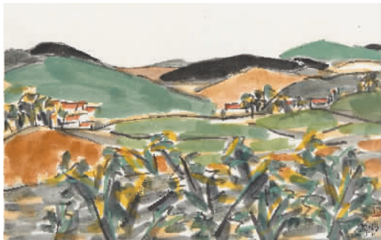
林逸鹏《云南情之五十六》